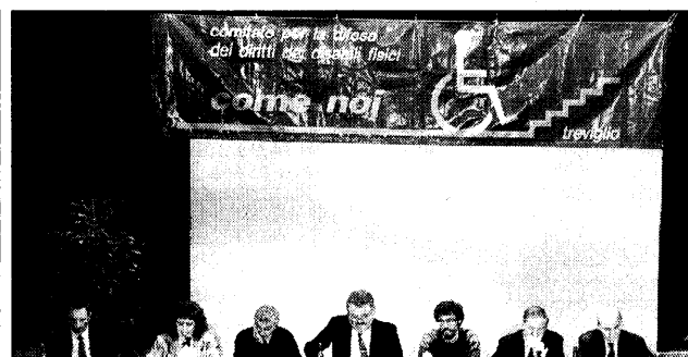
Due aspetti del teatro Fildrammatico di Treviglio durante la serata promossa dal comitato «Come noi»: in alto, il tavolo degli oratori; sotto, il foto pubblico intervenuto alla serata.

TREVIGLIO — «J'accuse». Così è partita da Treviglio la denuncia coordinata dal Comitato per la difesa dei diritti dei disabili fisici «Come noi» presieduto dal dr. Francesco Monzio Compagnoni, ma condivisa dalle centinaia di persone che venerdì 17 maggio hanno affollato il teatro «Fildrammatico» per prendere parte alla serata che proponeva una «lettura alternativa» della realtà.